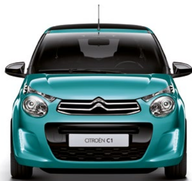
Zelená PACIFIC (N)

M – metalická farba; N – nemetalická farba; * len do vypredania skladových zásob