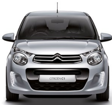
Sivá GALLIUM (M)