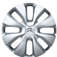
STAR Okrasný kryt 14"