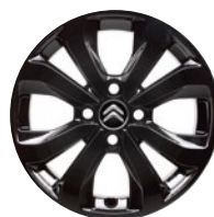
PLANET BLACK Hliníkové disky 15"