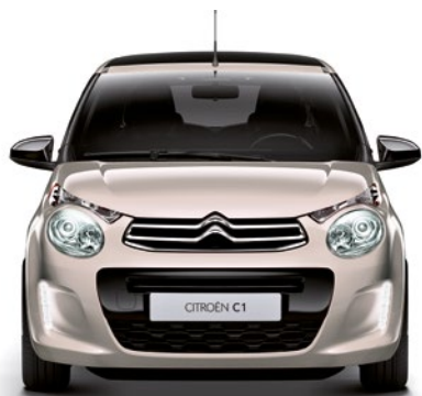
Běžová NUDE (N)