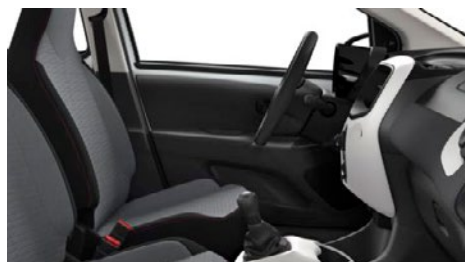
LÁTKA WAVE LIGHT CHERRY PINK