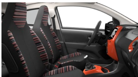
LÁTKA ZEBRA RED