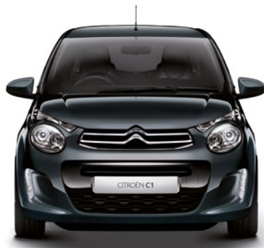
Sivá CARLINITE (M)