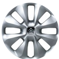
COMET Okrasný kryt 15"