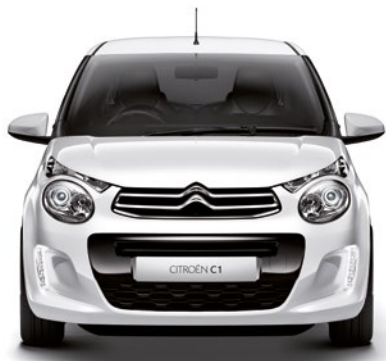
Biela LIPIZAN (N)