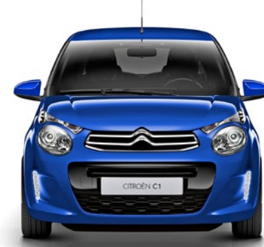
Modrá CALVI (M)