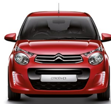
Červená SCARLET (N)