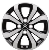
PLANET Hliníkové disky 15"