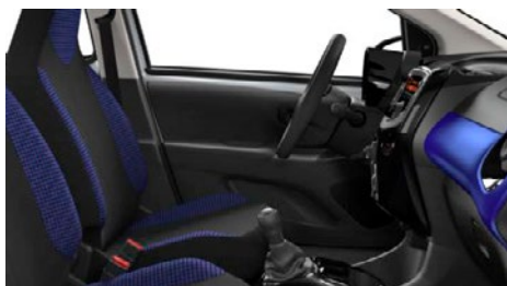
LÁTKA SQUARE BLUE