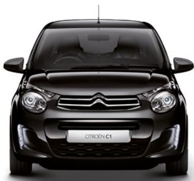
Čierna CALDÉRA (M)